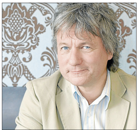
Lachen erlaubt: Kabarettist Jürgen Becker gastiert am Samstag, 29. Mai, ab 20 Uhr im Rundtheater Cultura.