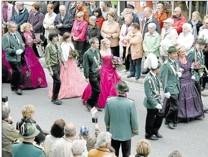
Perfekter Tag: Die Rietberger Schützen haben nach dem Bundeskönigntag ein durchweg positives Fazit gezogen. Viele Bruderschaften, die beim Umzug dabei waren, haben sich gestern per E-Mail für das gelungene Fest in der Emstadt bedankt.

Keine Frage also, dass die Emstädter den Verlern bei Bedarf beratend zur Seite stehen. Dort findet nämlich in zwei Jahren das nächste Bundeskönigntreffen statt.