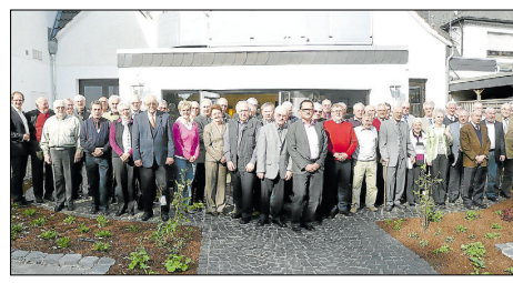
50 ehemalige Mitarbeiter der Grauhoff-Türeggruppe Mastholte haben sich jetzt bei einem Seniorentreff wiedergesehen.

Die Abfahrt erfolgt in Mastholte um 12.40 Uhr ab Kirche, in Bokel um 12.50 Uhr ab Kirche und in Rietberg um 13 Uhr ab Schnappchenmarkt. Um 15 Uhr wird eine Messe in der Wallfahrtskirche gefeiert, eine Klos-